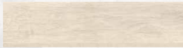
MN 10 20x80 cm 8x32 in 073