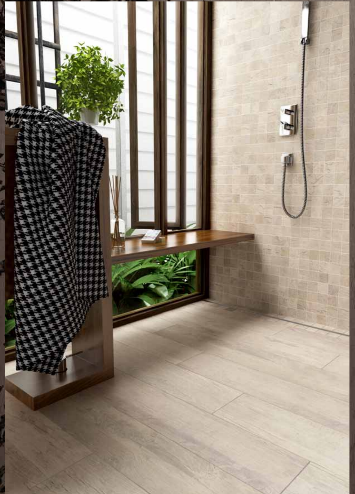
MN 10 - Mosaico / MN 10