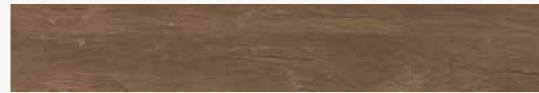
MN 9 16,5x100 cm 6 1/2x40 in 077