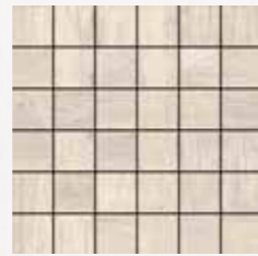
Mosaico / MN 10 30x30 cm 12x12 in 180