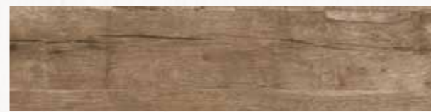
MN 9 20x80 cm 8x32 in 073