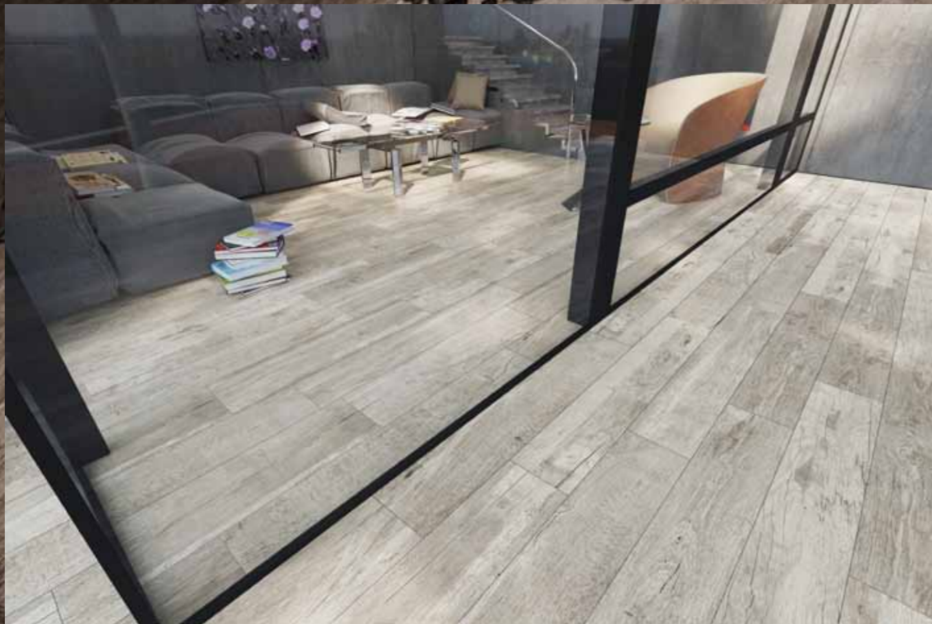
MN 5 - MG 5 Grip