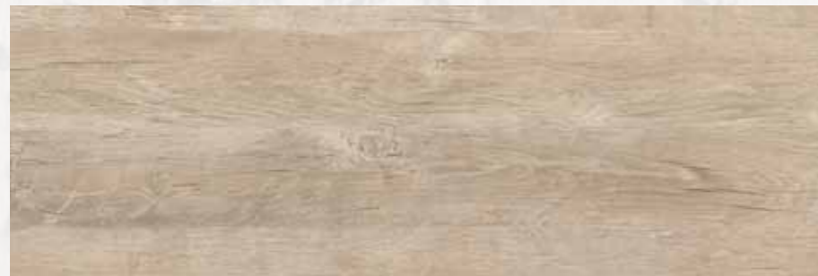
HMN 201 40x120 cm 16x48 in 150