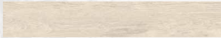
MN 10 16,5x100 cm 6 1/2x40 in 077