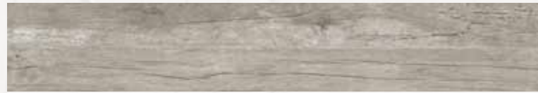
MN 5 16,5x100 cm 6 1/2x40 in 077