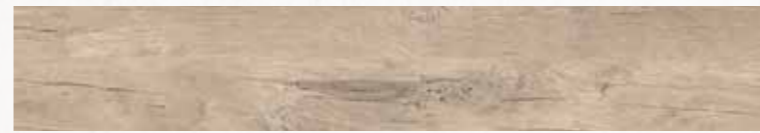
MN 1 16,5x100 cm 6 1/2x40 in 077