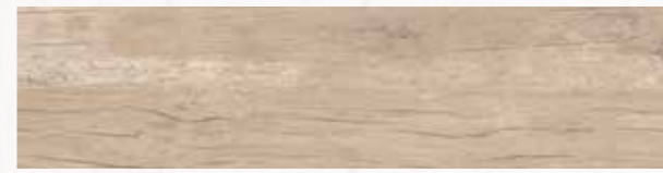
MN 1 20x80 cm 8x32 in 073