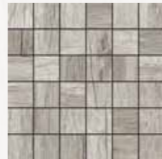
Mosaico / MN 5 30x30 cm 12x12 in 180