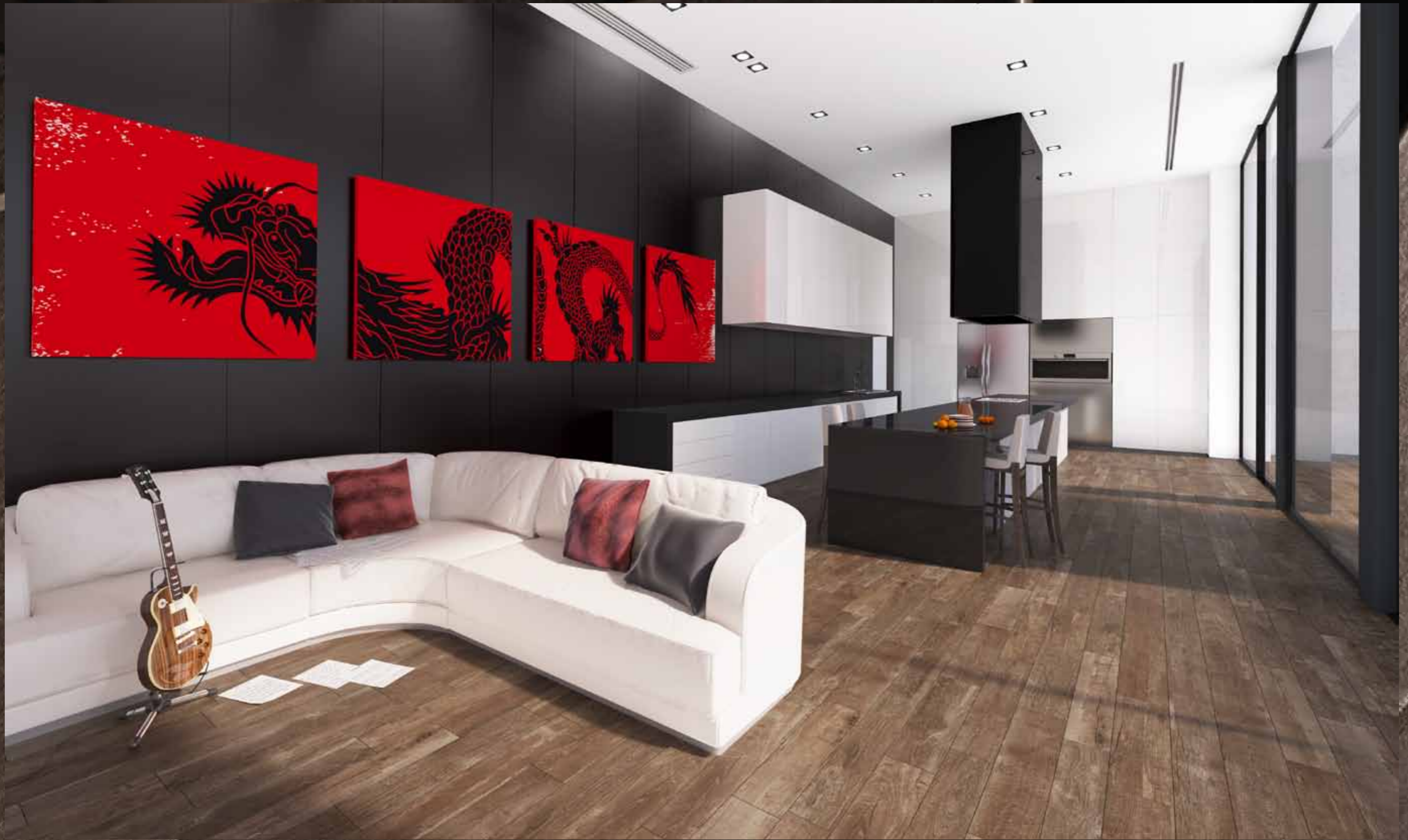
MN 9 - Mosaico / MN 9