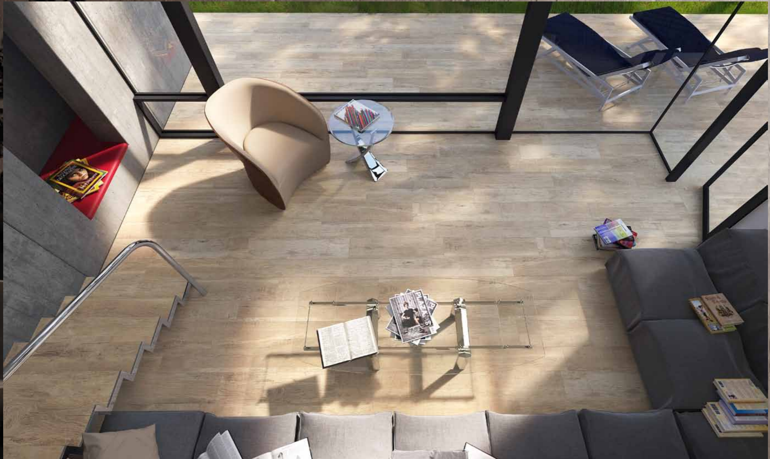
MN 1 - MG 1 Grip - Gradone Lineare / MN 1