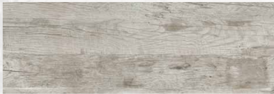
HMN 205 40x120 cm 16x48 in 150

Pezzi Speciali Formteile Special Pieces Pièces spéciales