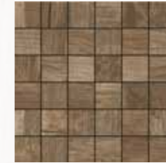
Mosaico / MN 9 30x30 cm 12x12 in 180