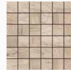
Mosaico / MN 1 30x30 cm 12x12 in 180