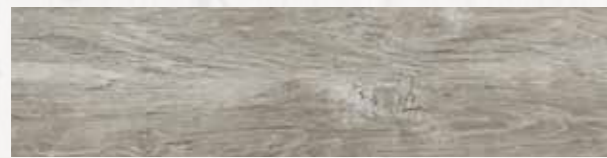
MN 5 20x80 cm 8x32 in 073