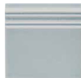
ADOC5063 - ADP41 RODAPIÉ 15 x 15 cm.