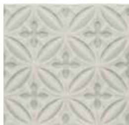
ADOC4004 - ADP35 RELIEVE CASPIAN 15 X 15 cm.