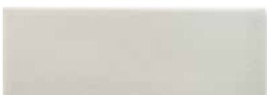
ADOC1008 - ADM24 LISO 7,5 X 22,5 cm.