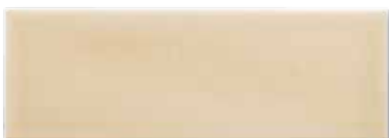
ADOC1007 - ADM24 LISO 7,5 X 22,5 cm.