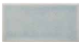
ADOC1001 - ADM22 LISO 7,5 X 15 cm.