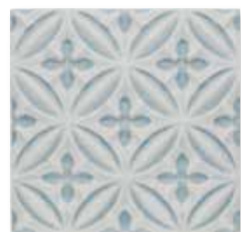
ADOC4001 - ADP35 RELIEVE CASPIAN 15 X 15 cm.