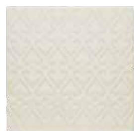
ADOC4006 - ADP35 RELIEVE PERSIAN 15 X 15 cm.