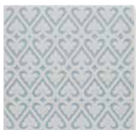
ADOC4005 - ADP35 RELIEVE PERSIAN 15 X 15 cm.