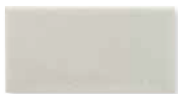
ADOC1004 - ADM22 LISO 7,5 X 15 cm.