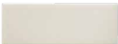
ADOC1006 - ADM24 LISO 7,5 X 22,5 cm.