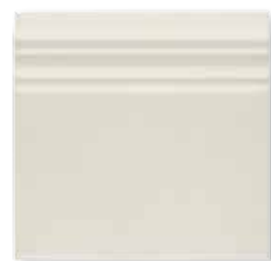
ADOC5064 - ADP41 RODAPIÉ 15 X 15 cm.