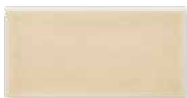
ADOC1003 - ADM22 LISO 7,5 X 15 cm.