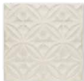
ADOC4002 - ADP35 RELIEVE CASPIAN 15 X 15 cm.