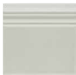
ADOC5066 - ADP41 RODAPIÉ 15 X 15 cm.