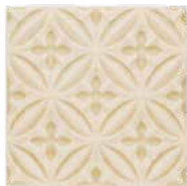
ADOC4003 - ADP35 RELIEVE CASPIAN 15 X 15 cm.