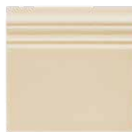
ADOC5065 - ADP41 RODAPIÉ 15 X 15 cm.