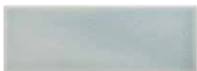
ADOC1005 - ADM24 LISO 7,5 X 22,5 cm.