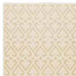
ADOC4007 - ADP35 RELIEVE PERSIAN 15 X 15 cm.