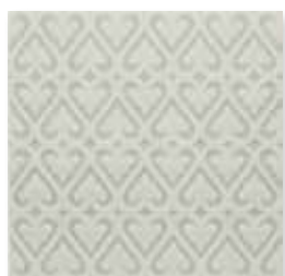
ADOC4008 - ADP35 RELIEVE PERSIAN 15 X 15 cm.